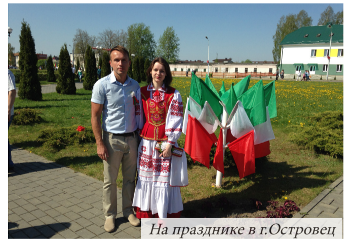
На празднике в г.Островец

быстро растет, меняется, он красив, чист, ухожен. Он стал для меня по-настоящему родным и любимым, тем уютным местом, куда я с радостью возвращаюсь даже после непродолжительных поездок. Много можно написать о нем – и о том, какое удовольствие и душевный подъем получаешь, неспешно прогуливаясь по нему, и о том, насколько же он хорош – если ты это замечаешь!