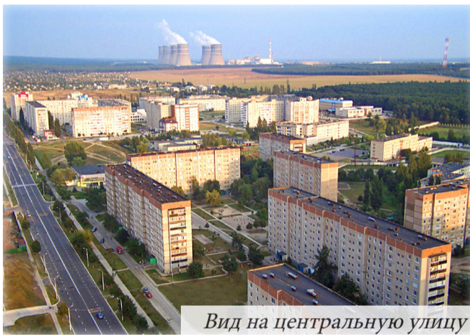
Вид на центральную улицу

«Любимый город может спать спокойно» - эта фраза из песни передает значение твоей деятельности. Ощущение, что ты не живешь бесцельно, а действительно занимаешься важным и полезным делом.