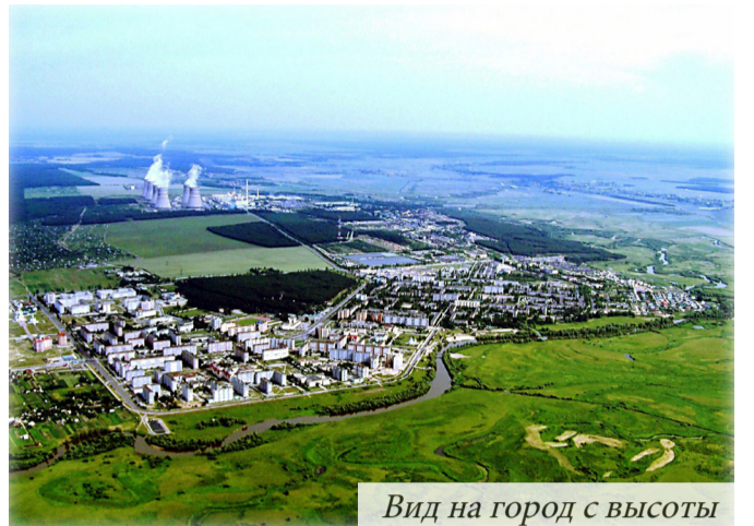
Вид на город с высоты

Дом, где ты жил, родной дворик и школа, стадион, лес, речка, каждая тропинка, каждое дерево и кустик, где все знакомо до мельчайших подробностей – эти места и события, происходившие и связанные с ними, с нежностью и легкой ностальгией по ним хранятся в душе. Они дороги и памятны, они